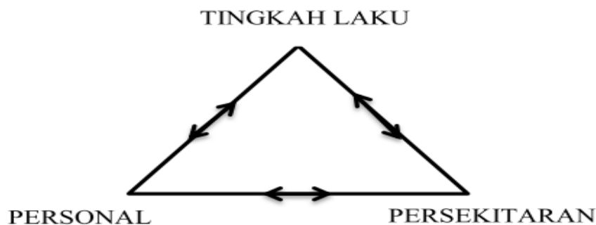
Rajah 1: Perhubungan Timbal Balik oleh Bandura (1986)

Faktor luaran merupakan perkara diluar jangkaan pelajar seperti status sosio-ekonomi, persekitaran, komuniti dan penglibatan ibu bapa (Fatimahwati & Chieng 2016). Menurut Fatimahwati & Chieng (2016), ibu bapa berperanan melaksanakan perubahan dan memperbaiki keadaan sedia ada. Tingkah laku pelajar boleh berubah mengikut persekitaran yang berlaku. Ia disebabkan oleh pemikiran dan trait personaliti pelajar (Shafinaz 2017). Perhubungan ini menurut Bandura (1986) adalah konsep timbal balik ( reciprocal determinism ). Timbal balik ini meliputi faktor dalaman berbentuk kognitif, tingkah laku dan pengaruh persekitaran (faktor luaran) seperti yang ditunjukkan dalam Rajah 1.