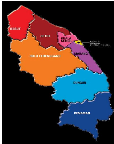
Rajah 2: Kedudukan Daerah Marang dalam Peta Negeri Terengganu

Justifikasi pemilihan daerah Marang sebagai lokasi kajian kes adalah kerana ia terletak di pesisir pantai Terengganu. Selain itu, daerah ini didapati banyak membangunkan chalet dan resort pinggir pantai, perusahaan hasil laut, kraftangan dan batik. Jadual 1 menunjukkan 20 buah chalet berserta alamat yang beroperasi di pesisir pantai Marang.